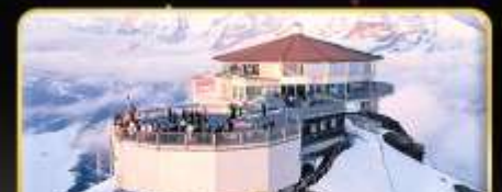
ทานอาหารที่ Piz Gloria ภัตตาคารที่หมุนได้ 360 องศา