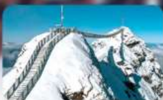
พิชิต 3 ยอดเขาดัง Rigi / Schilthorn / Glacier 3000