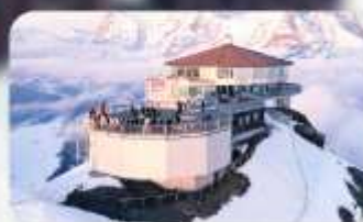
ทานอาหารที่ Piz Gloria ภัตตาคารที่หมุนได้ 360 องศา