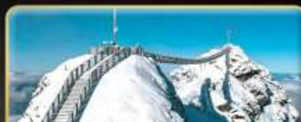
พิชิต 3 ยอดเขาดัง Rigi / Schilthorn / Glacier 3000