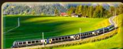
นั่งรถไฟสายโรแมนติก 2 สาย Golden Pass / Luzern Interlaken Express

📅 เดินทาง: 5-12 เม.ย. | 31 พ.ค.-7 มิ.ย. 69