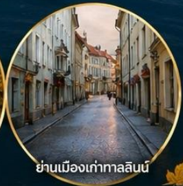
ย่านเมืองเก่าทาลลินน์