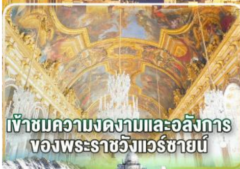
เข้าชมความงดงามและอลังการ ของพระราชวังแวร์ซายน์