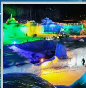
"SOUNKYO ICE FEST"