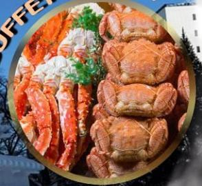
SAPPORO SNOW FESTIVAL 2027