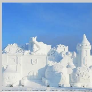
"ASAHIKAWA SNOW FEST"