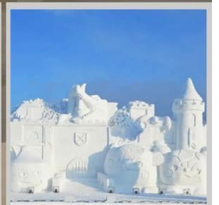
"ASAHIKAWA SNOW FEST"