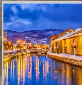
"OTARU CANAL FEST"