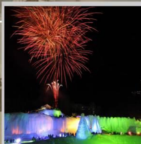
"SOUNKYO ICE FEST"