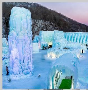
"LAKE SHIKOTSU FEST"