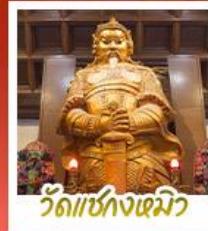
วัดเข่งงเมิว