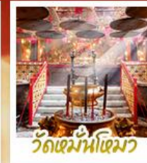
วัดเม้านไทมว