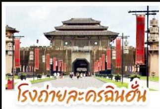
โรงถ่ายละครฉินฮั่น

ชมวิวน้ำพุร้อนบ้านม้งซีเจียงพันหลังคา • อุทยานเสี้ยวซิ่ง มนต์เสน่ห์จิวจิวโกวน้อย • อิสระช้อปปิ้งกับถนนคนเดิน สามตรอกสองซอย • สูดอากาศที่ตีตัมปอดบนยอดเขาชิงซิ่ง พร้อมชมความสวยงามของมวลดอกไม้ตามฤดูกาล