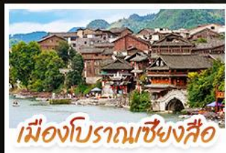
เมืองโบราณเซียงสือ