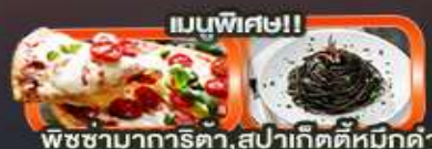
เมนูพิเศษ!! พืชซากการิตา, สปาเก็ตตี้หมักดำ