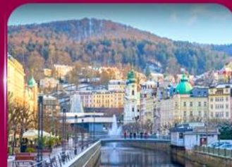
เมืองสปาแสนสวย คาร์โลวี วารี