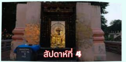
สัปดาห์ที่ 4