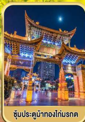
ซุ้มประตูม้าทองไถ่มรดก