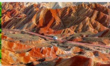
ภูเขาสายรุ้งจางเย่ต้นเสี่ย