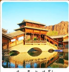
เมืองเล็กตันเสี่ยโซ่ว