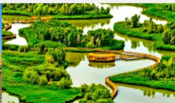
อุทยานพื้นที่ชุ่มน้ำจางเย่