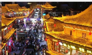
ตลาดกลางคืนจางเย่

*ทางบริษัทฯ ขอสงวนสิทธิ์ในการสลับโปรแกรมทัวร์ตามความเหมาะสมขึ้นอยู่กับสถานการณ์หน้างาน โดยคำนึงถึงผลประโยชน์ของลูกค้าเป็นสำคัญ