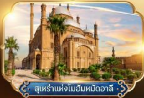
สุเหร่าแห่งโมฮัมหมัดอาลี