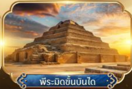
พีระมิดขั้นบันได