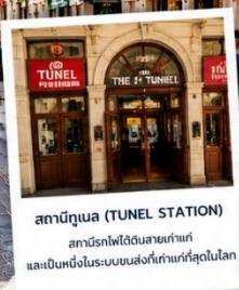
สถานีทูเนล (TUNEL STATION) สถานีรถไฟใต้ดินสายเก่าแก่ และเป็นหนึ่งในระบบขนส่งที่เก่าแก่ที่สุดในโลก