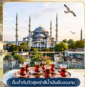
ต้นตากับวิวกุสุเหร่าสีน้ำเงินอันงดงาม

พิเศษ...สุดๆ! นำท่าน ขึ้นสู่จุดเช็คอินแห่งใหม่ Seven Hills Café ซึ่งเป็นสถานที่ยอดนิยมขณะนี้..บนชั้นดาดฟ้า ของโรงแรมเซเวนฮิลล์ส ท่านจะได้ถ่ายรูปกับวิวมุมต่าง ๆ ช่องแคบบอสฟอรัส, สุเหร่าสีน้ำเงินและสุเหร่าฮาเกียโซเฟีย พร้อม ให้อาหาร กับเหล่านกนางนวลที่จะบินมารับอาหารจากท่าน **ขออนุญาตท่านที่ชื่นชมความงามวิวกว้อยล้าน ช่วยอุดหนุนเครื่องดื่ม ชา กาแฟ ซอฟดริงค์ อื่นๆ ตามต้องการ