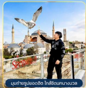
มุขถ่ายรูปรยอดฮิต ใกล้ฮิลดกนางนวล