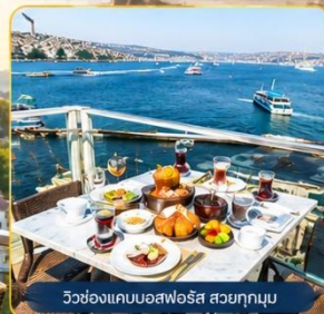
วิวช่องแคบบอสฟอรัส สวยทุกมุม