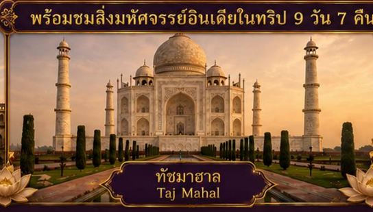
ทัชมาฮาล Taj Mahal