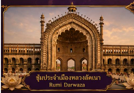
ซุ้มประจำเมืองหลวงลัคเนา Rumi Darwaza

พร้อมชมสิ่งมหัศจรรย์อินเดียในทริป 9 วัน 7 คืน