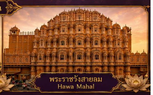
พระราชวังสายลม Hawa Mahal