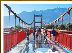
สะพานแก้วลี้เจียง