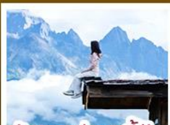
ร้านอาหารทะเลขึ้นต้นอัน

ชมวิวภูเขาหิมะสวยสุดโรแมนติกกับแสงยามพลบค่ำ เที่ยวเมืองโบราณต้าหลี่ ลี้เจียง ป่าชา แซงกรี่ล่า ชมวิถีชีวิตของชุมชนยูนนานและทิเบต พิสูจน์ความกล้าท้าเดินชมสะพานแก้วลี้เจียง • ซุปโป่งเพลินที่ถนนคนเดินหนานผิงเจียง