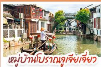
หมู่บ้านโบราณจูเจียงเจี๋ยว

สวนสนุกเซี่ยงไฮ้ดิสนีย์แลนด์ เต็มวัน (รวมรถรับ-ส่ง)