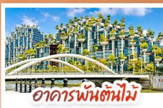
อาคารพันตันไม้