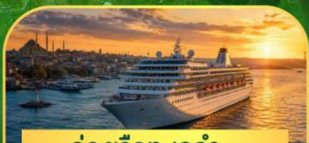
ล่องเรือทะเลดำ