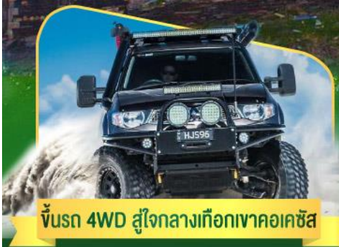
ขึ้นรถ 4WD สู่ใจกลางเทือกเขาคอเคซัส