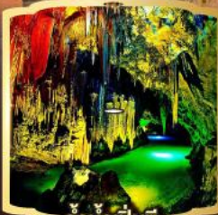
ถ้ำน้ำเป็นซี