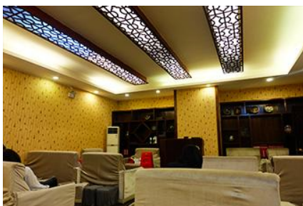
ศูนย์แพทย์แผนจีน

อัตราค่าบริการสำหรับโปรแกรมเสริมการแสดงชุด The love Story of Wooden man and Fairy Fox ท่านละ 400 หยวน (หรือประมาณ 2000.-บาทขึ้นอยู่กับอัตราแลกเปลี่ยน) ระยะเวลาที่ใช้ในการเที่ยวชมการแสดง ประมาณ 3 ชั่วโมง รวมเวลาเดินทางไปกลับค่าบริการรวม ค่าบัตรเข้าชม ค่ารถรับ ส่ง และค่าน้ำทิพย์ของไกด์ท้องถิ่น