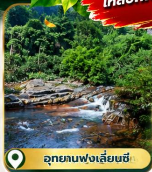
อุทยานฟ่งเลี่ยนซี