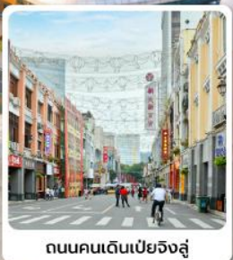
ถนนคนเดินเป่ย์จิงลู่