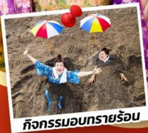
กิจกรรมอบทรายร้อน