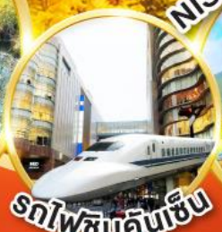
รถไฟชินคันเซ็น

สนุกกับกิจกรรม อบอุ่น นิ่งเฟอร์รี่สู่เกาะซากุระจิมะ นิ่งรถไฟชินคันเซ็นจากเมืองคาโกชิม่าสู่เมืองฟุกุโอกะ