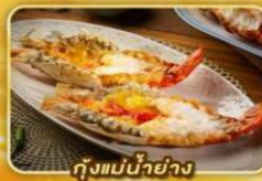
กุ้งแม่น้ำย่าง