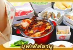
บูฟเฟต์ชาบู