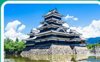
ปราสาทมัตสึโมโด้