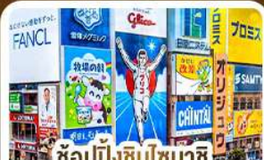
ช้อปปิ้งชินโซบาชิ และโดตงโบริ