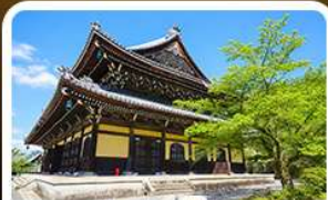
วัดนันเซ็นจิ