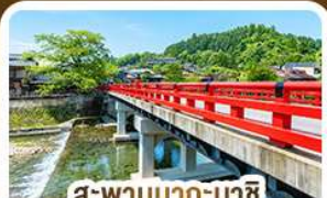
สะพานนากะบาชิ ทาคายาม่า