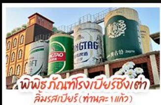
พินิจภัณฑโรงเบียร์ชิงเต่า คิมรสเบียร์ (ท่าทะเล 1 แก้ว)