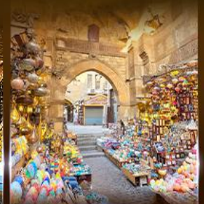
ตลาดงานเทศกาล