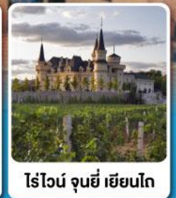
ไร่ไวน์ จุนยี่ เยียนไถ