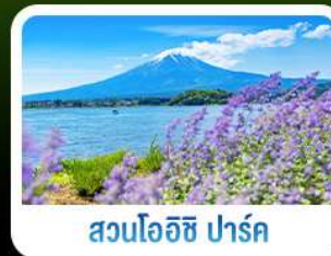
สวนโออิชิ ฟูจิ