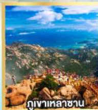
กุเขาเหลาซาน