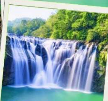
น้ำตกซือเฟิ่น