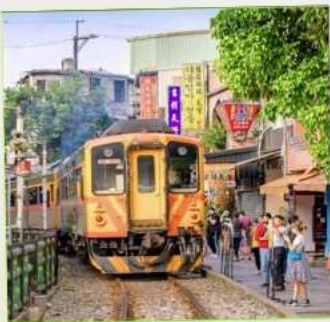
สถานีรถไฟซือเฟิ่น