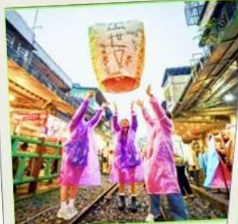
ปล่อยโคมลอย