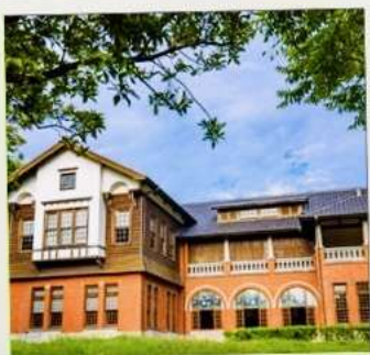
พิพิธภัณฑน์น้ำพุร้อนเป่ย์โถว