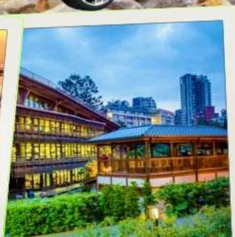
ห้องสมุดเป่ย์โถว