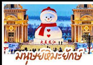
มนุษย์หิมะยักษ์