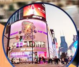
ถนนหนานจิง