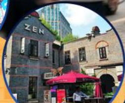
ซินเทียนตี้