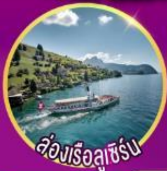
ล่องเรือลูซิิร์น