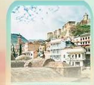
อะบาห์ตุบาห์