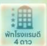
พักโรงแรมดี 4 ดาว