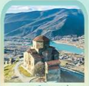
มทวิซาร์จวารี