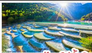
ภูเขาพระจันทร์สีน้ำเงิน

ภูเขาหิมะมังกรหยก - เมืองโบราณแชงกรีล่า วัดลามะชงจันหลิน - รถไฟขบวนวิภูเขาหิมะมังกรหยก สวนดอกไม้ฮาวู๋มู่ฉ่าง - เมืองโบราณลี่เจียง ภูเขาพระจันทร์สีน้ำเงิน - เบบูพิศข สุกีปลาแซลมอน