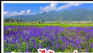
สวนดอกไม้ฮาวู๋มู่ฉ่าง