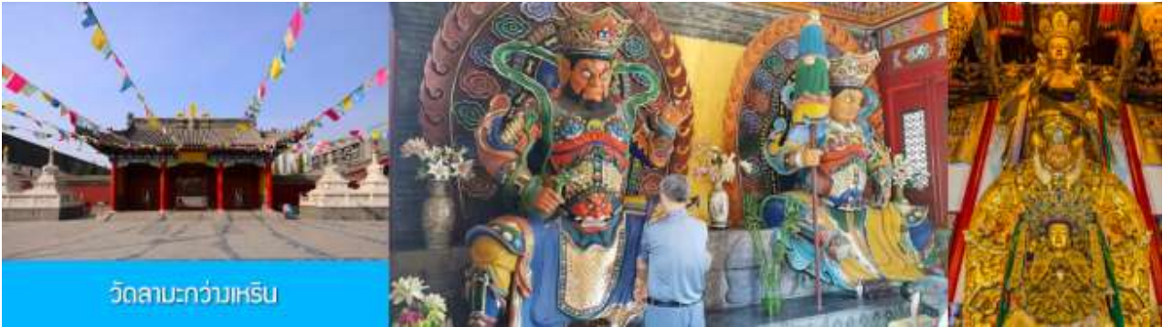
วัดลามะกว่างเหริน