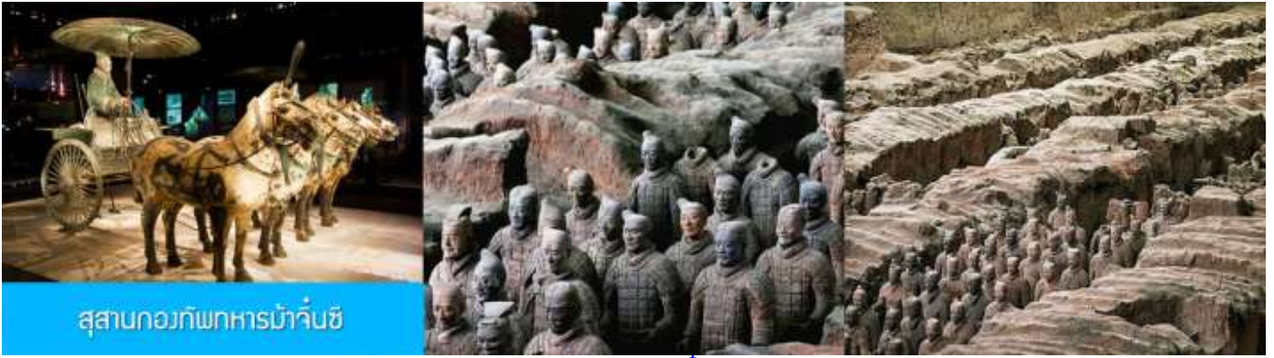
สุสานกองทัพทหารม้าจีน