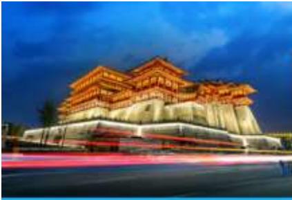
นครลั่วหยาง