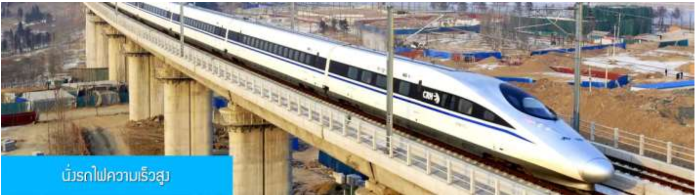
เมืองรถไฟความเร็วสูง

หลังอาหารนำท่านเดินทางสู่สถานีรถไฟความเร็วสูงนครซีอาน เพื่อเตรียมเดินทางสู่นครฉว่หยาง