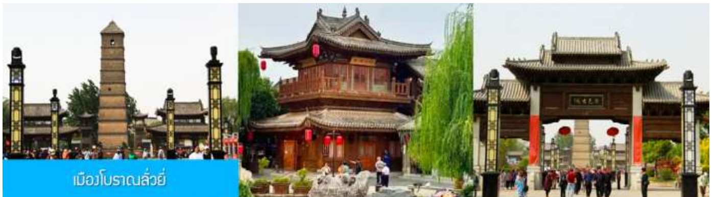
เมืองโบราณฉว่หยี่

16.18 น. ขบวนรถไฟนำคณะเดินทางถึงสถานีรถไฟนครฉว่หยาง นำคณะขึ้นรถบัสเพื่อเดินทางสู่ นครฉว่หยาง