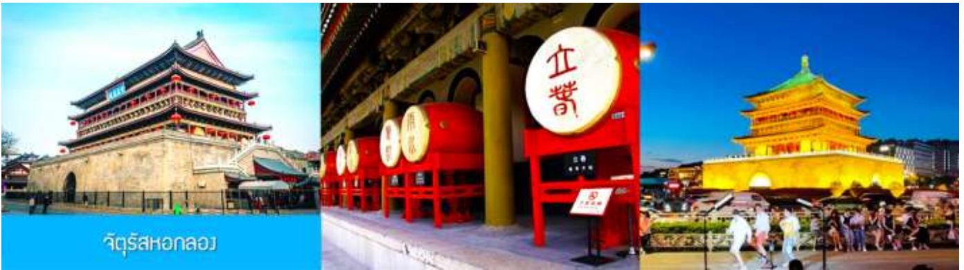
จัตุรัสหอกลอง