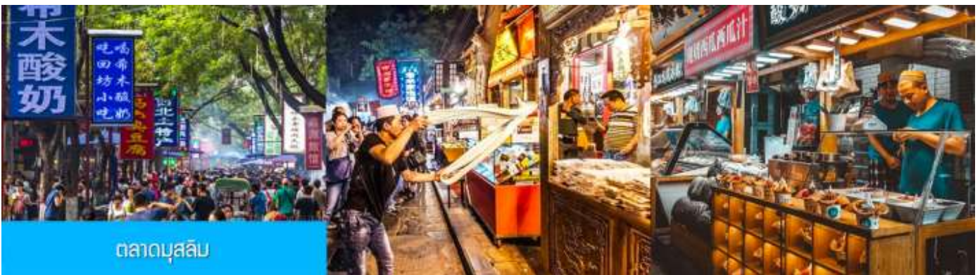
ตลาดบุนสลิบ