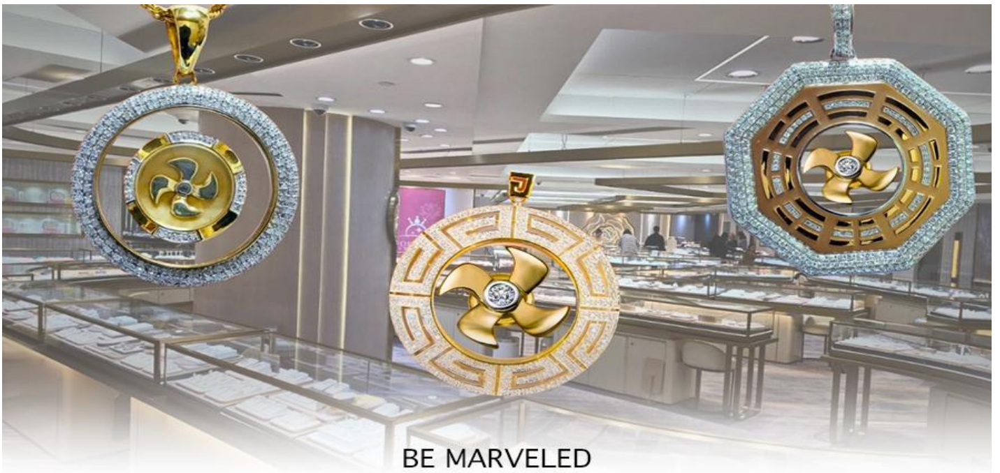
BE MARVELED ศูนย์ฮวงจุ้ย กังหันเศรษฐี

นำท่านชม ศูนย์ฮวงจุ้ย กังหันเศรษฐี ที่ขึ้นชื่อของฮ่องกง ท่านจะได้พบกับงานดีไซน์ที่ได้รับรางวัลยอดเยี่ยม และใช้ในการเสริมดวงเรื่องฮวงจุ้ย โดยการย่อใบพัดของกังหันที่เป็นสัญลักษณ์ของวัดวัดเซ่งหิม มาทำเป็นเครื่องประดับ ไม่ว่าจะเป็นจี้, แหวน, กำไล หรือต่างหูเพื่อเป็นเครื่องประดับติดตัว และเสริมดวงชะตา ซึ่งสินค้าทุกชิ้น มีเอกสาร รับประกันคุณภาพเปลี่ยนหรือซ่อม ได้ตลอดอายุการใช้งาน หากเกิดการชำรุดจากสินค้าไม่ใช่อุบัติเหตุ