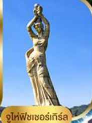
จูไห่ฟิชชอร์ทิวรา