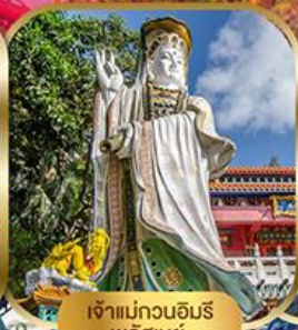
เจ้าแม่กวนอิม พลัสเบย์