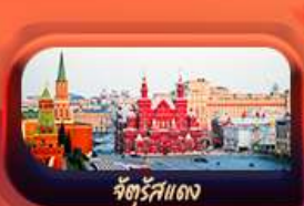
จัตุรัสแดง