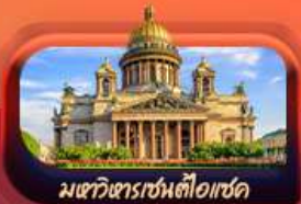
มหาวิหารเซนต์ไอแซค