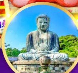
วัดโคโคคุอิน