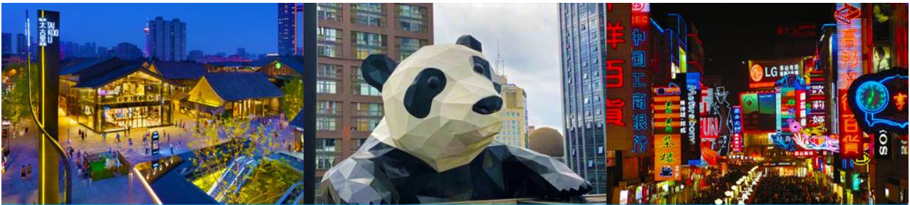
ถนนไท่กุ่หลี่ และวัดต้าเจี๊อ