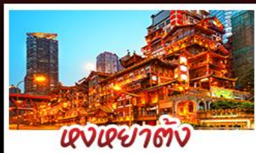
แดงยาตัง