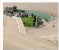
เขื่อนทรายหมิงซาซาน