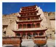
ถ้ำม่อเกาตุ