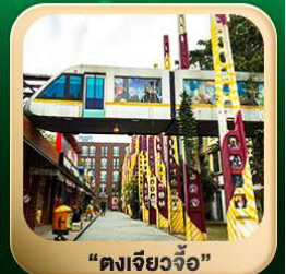
“ตงเจียวจื่อ”