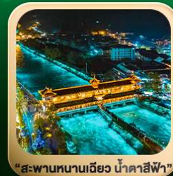
“สะพานหนานเฉียว น้ำคาสีฟ้า”