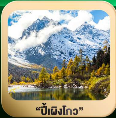
“ปี่ฝิงโกว”

ชมธรรมชาติ 2 อุทยานขึ้นชื่อ อุทยานภูเขาสีดรุณี + อุทยานปี่ฝิงโกว สะพานหนานเฉียว • ถนนคนเดินไท่กุ่หลี่ + ซุนซีลู่ + Pop Mart • ตงเจียวจื่อ