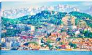
หมู่บ้านชาวประมงซาจื่อโซว