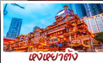
เจงเฉาตัง