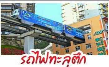
รถไฟทะลุติ๊ก