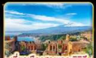
เที่ยวเมืองสวยเกาะซิซิลี Taormina