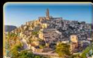
ตามรอย 007 เมือง Matera