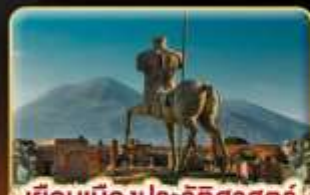
เยือนเมืองประวัติศาสตร์ ปอมเปอี