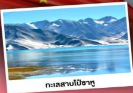
ทะเลสาบไปซาทุ

เปิดประตูสู่อารยธรรมพันปีแห่งซินเจียงใต้ ชมความสวยงามของหมู่บ้านดอกแอปเปิ้ล