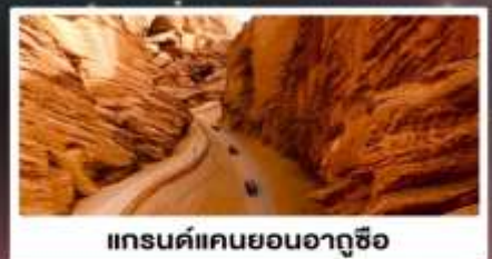
แกรนด์แคนยอนอาถูซือ