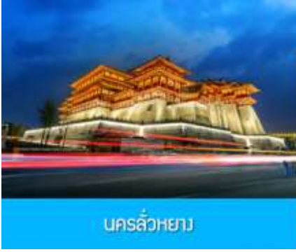
นครลั่วหยาง