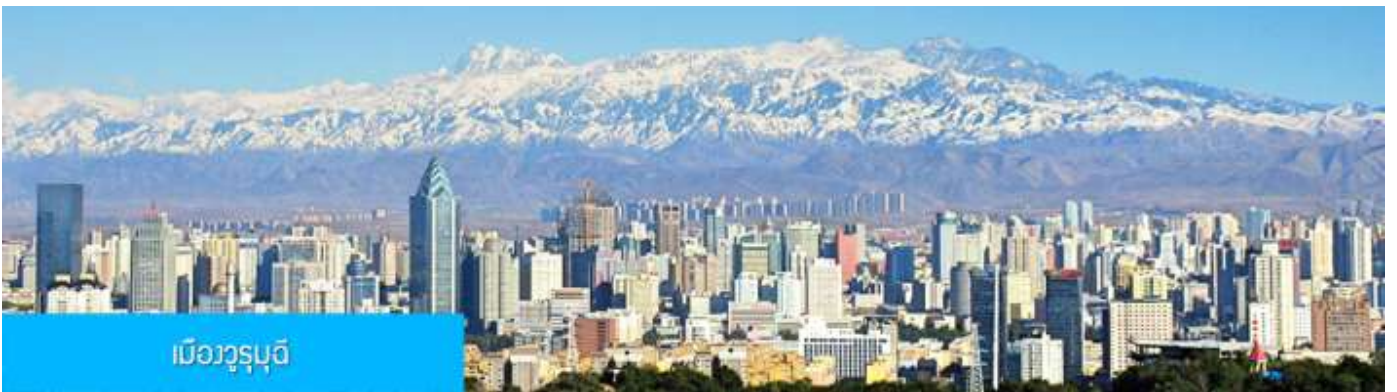
เมืองูรูมูฉี